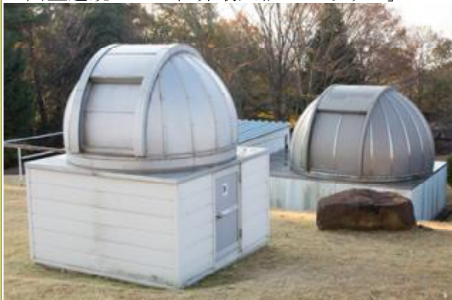
ここにある貸出望遠鏡