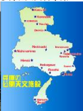
猪名川天文アストロピア