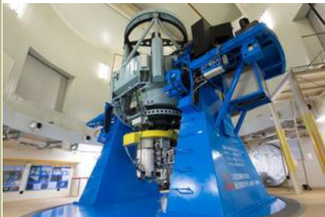
公開望遠鏡として世界最大級の「なゆた」