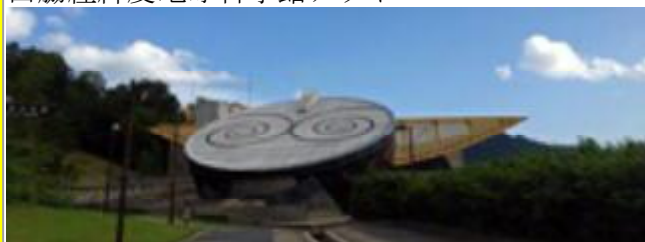
三田市野外活動センター天体観測所